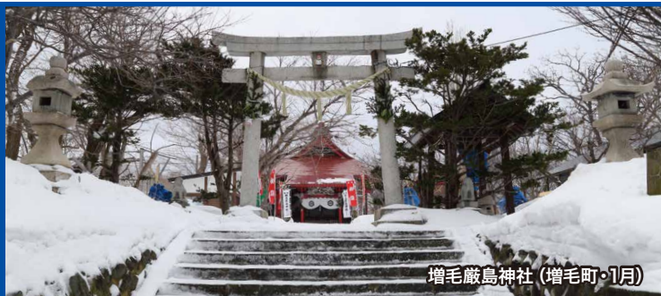
増毛厳島神社 (増毛町・1月)