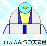
しょさんべつ天文台